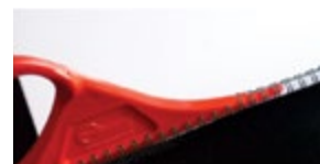
RECOsystems отварач за метални спирали