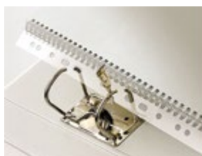
Додаток за укоричување, ПВЦ