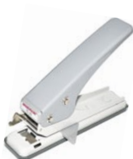
Дупчалка за календар RENZ TC 20